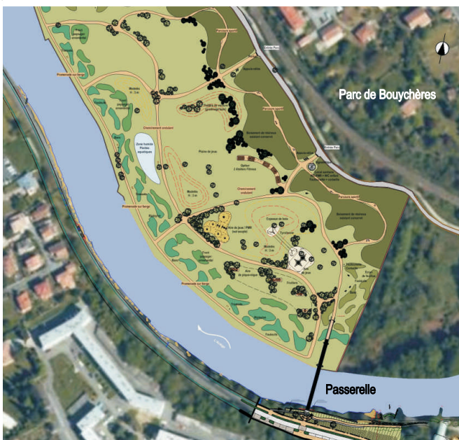
Passerelle (60 m de long) et rampe PMR en encorbellement