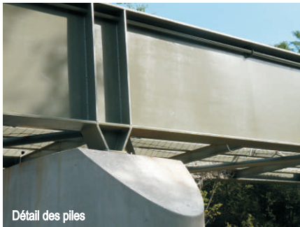
Détail des piles