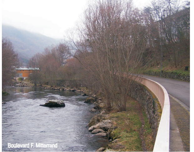
Boulevard F. Mitterrand