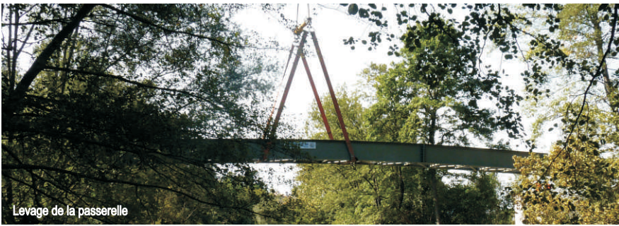
Levage de la passerelle