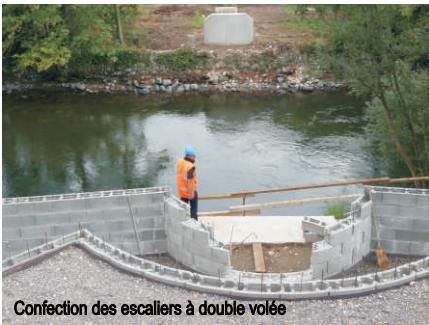
Confection des escaliers à double volée