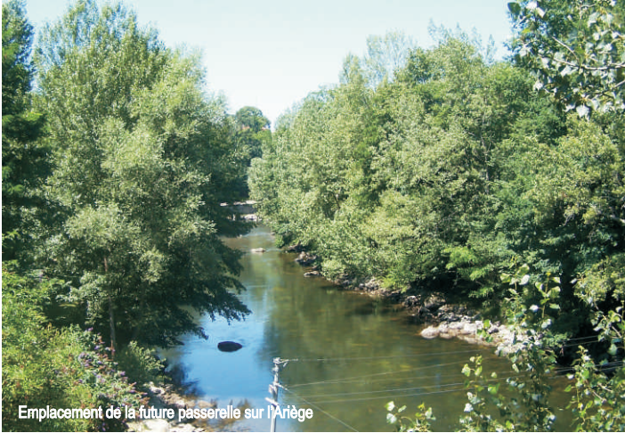
Emplacement de la future passerelle sur l'Ariège